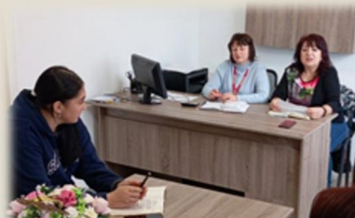
відділення професійно-технічної освіти

Серед пріоритетних тем засідань була безпека здобувачів освіти, зокрема дотримання правил поведінки під час повітряних тривог та надзвичайних ситуацій. Наголошувалося на важливості відповідального ставлення кожного здобувача до власного життя та безпеки оточуючих.